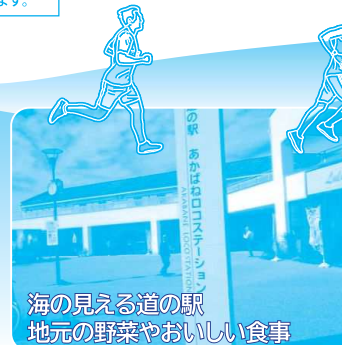
海が見える道の駅 地元の野菜やおいしい食事