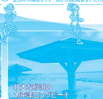
壮大な砂浜の 太平洋ロングビーチ